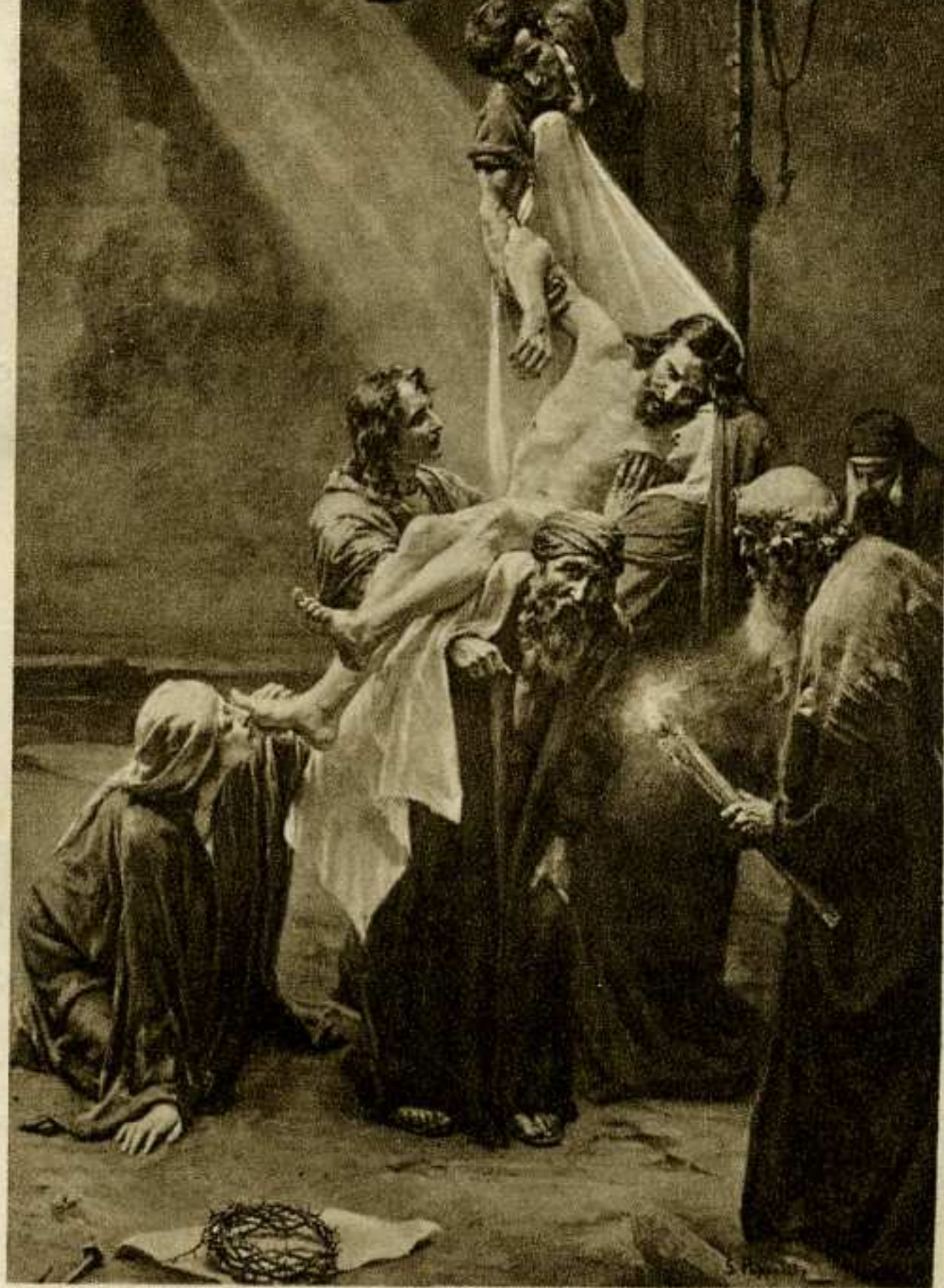
DESCENDIMIENTO DE LA CRUZ